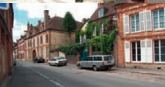
Les hôtels particuliers implantés, en retrait de la rue, entre cour et jardin (XVIII e siècle).