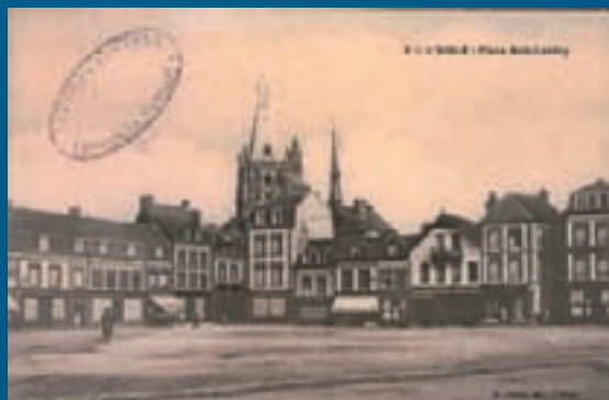
Les bâtiments de la place Boislandry n'ont pas subi de grandes transformations depuis le début du XX e siècle à l'exception des devantures commerciales.