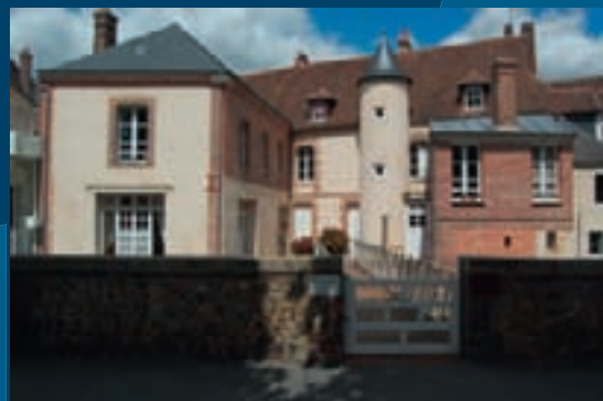
Patrimoine remarquable de la place Boislandry.