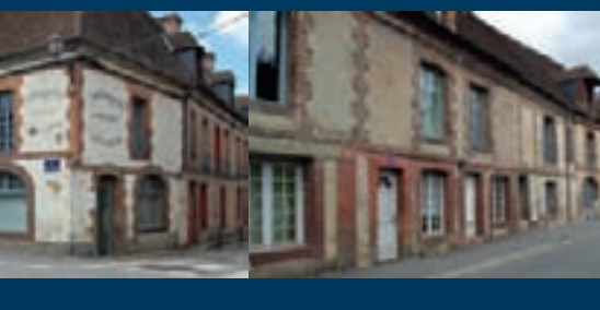
Les maisons de ville mitoyennes et alignées le long de la rue.