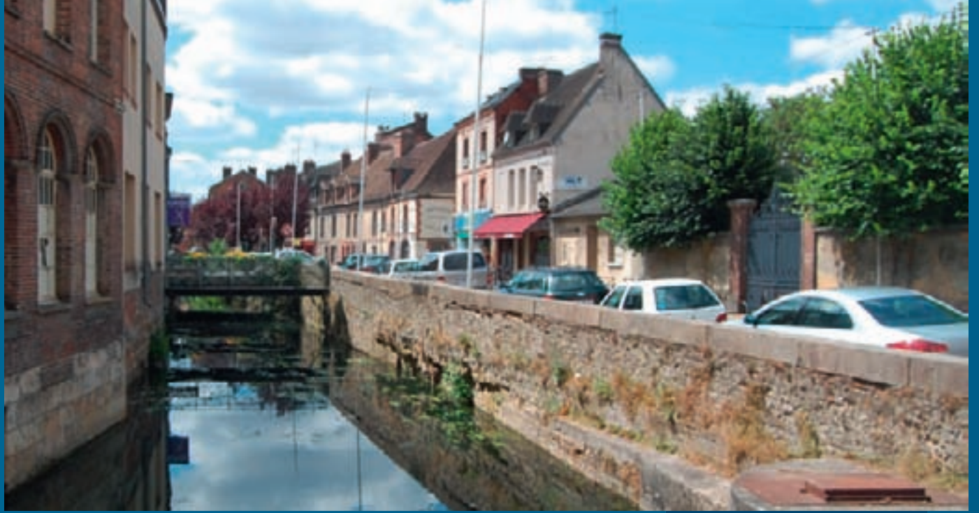
Le canal Saint-Martin, rue de l'Abreuvoir Saint-Martin et Quai Catel

La promenade le long du bras Saint-Martin permet de découvrir un patrimoine remarquable en grande partie du XVIII e siècle. Quai Catel et rue de l'Abreuvoir Saint-Martin, un front bâti continu longe les berges. Les ponts offrent des vues remarquables sur l'enfilade des ponts et des passerelles de la Risle. Différents espaces publics- réseau de rues vers l'église Saint-Martin et le château, places de l'Europe et Boislandry - structurent le site.