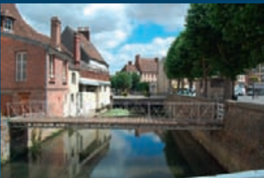
Les passerelles de la place Boislandry.